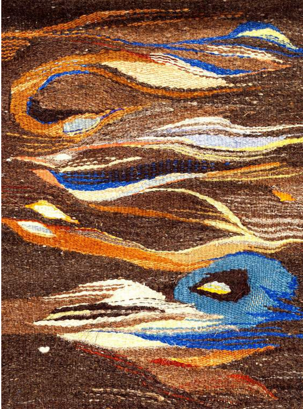
Inge Bjørn Jordliv , 1958 Silk, linen, wool 54h x 43w cm