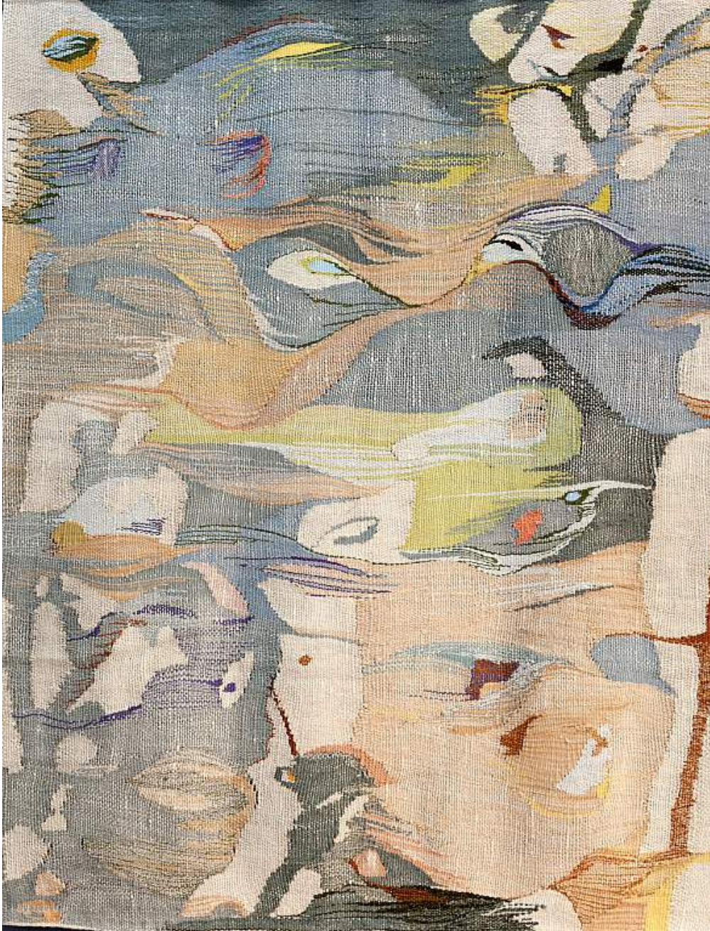
Inge Bjørn Vinterbark , 1973 Silk, linen, wool 169h x 131w cm