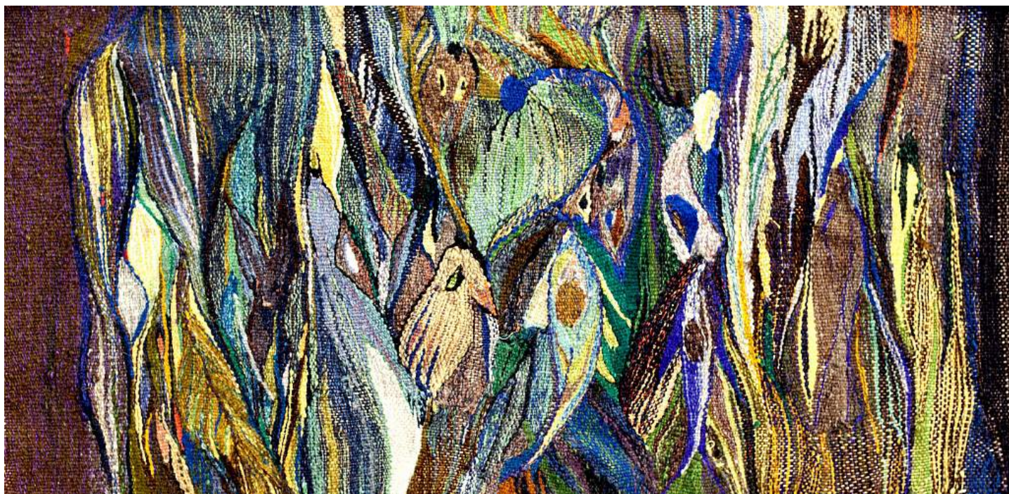
Inge Bjørn Pigen i skoven , 1961 Silk, linen, wool 48h x 97w cm