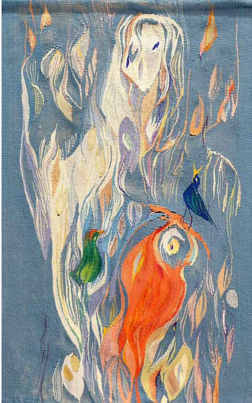
Inge Bjørn Fra serien Vår, 1971 Silk, linen, wool 119h x 77w cm