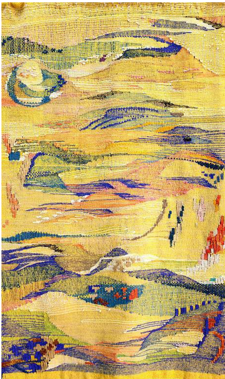
Inge Bjørn Untitled , Undated Silk, linen, wool 93h x 58w cm