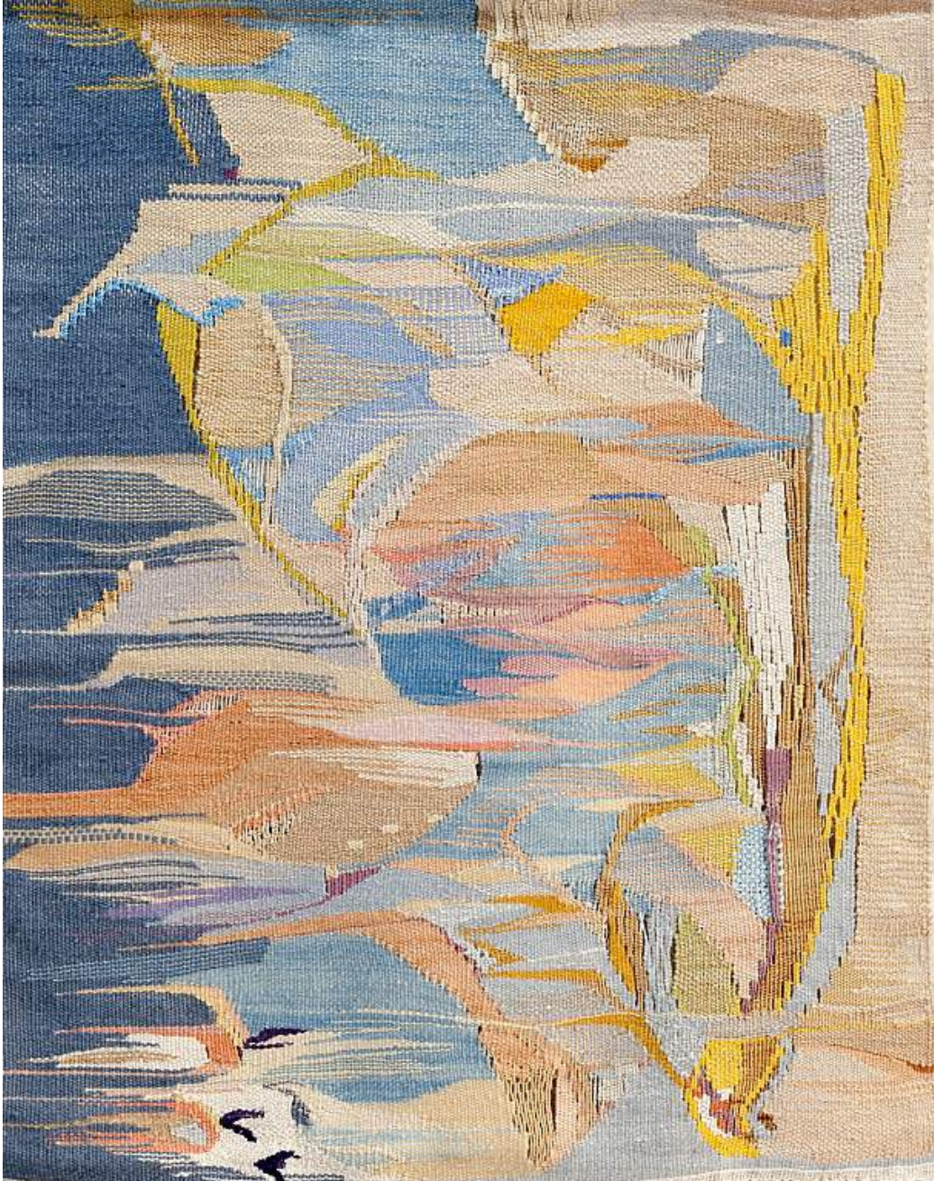
Inge Bjørn Lys og skygge , 1992 Silk, linen, wool 95h x 75w cm