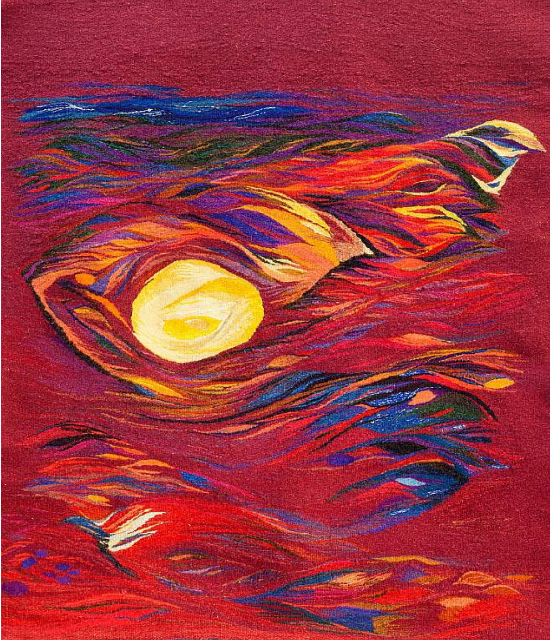
Inge Bjørn Sammensmeltning , 1961-62 Silk, linen, wool 107h x 69w cm