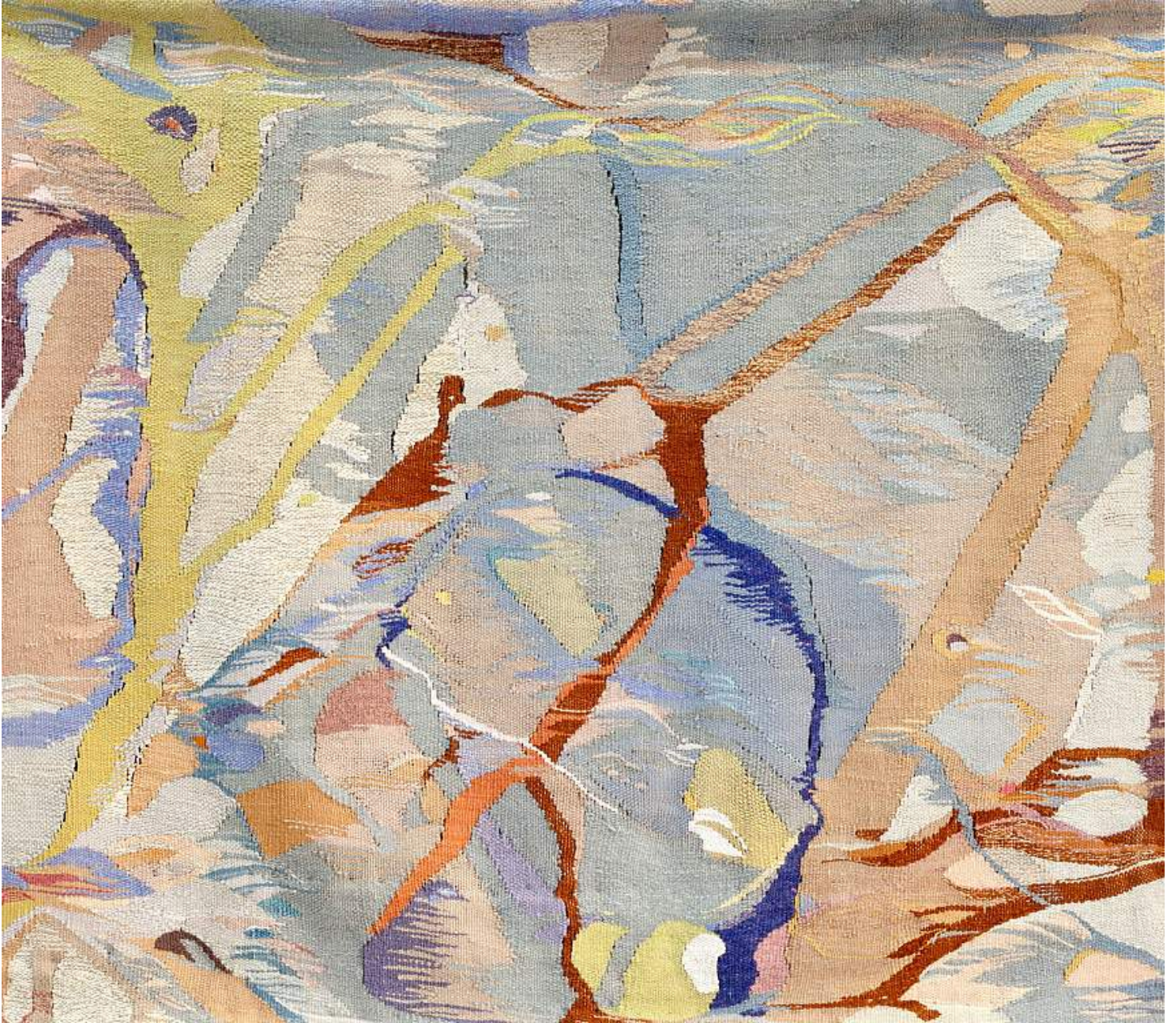
Inge Bjørn Ved bækken , 1978 Silk, linen, wool 112h x 128w cm