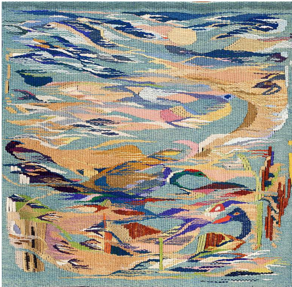
Inge Bjørn Tæt på havet, 2007 Silk, linen, wool 142h x 150w cm